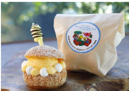
『丘ばちスイーツバーガー〈プレーン〉』 550 円 ※テイクアウト 540 円 素材の美味しさをシンプルにお楽しみいただけます。