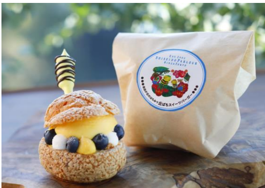
『丘ばちスイーツバーガー〈本日のフルーツ〉』 712 円 ※テイクアウト 699 円 パティシエお薦めのその日のフルーツを使い、仕上げます。