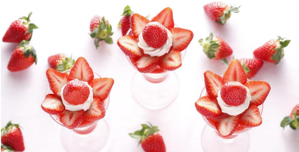
『2021 こだわりの苺フェア』最終第三弾：3月2日（火）～31日（水）

「資生堂パーラー 銀座本店サロン・ド・カフェ」では、2021年1月3日（日）から3月31日（水）までの期間、『2021 こだわりの苺フェア』を開催中です。時期に合わせて美味しい苺の品種を厳選し、パフェなどのデザートに仕立てます。最終の第三弾となる3月は、“おおきみ” “レッドパール” “まりひめ” の3品種で「ストロベリーパフェ」を展開。それぞれの苺と伝統のバニラアイスクリームが織りなすハーモニーが味わえます。また、同時に『東京銀座資生堂ビル 20周年』記念メニューもご用意。伝統メニューやヴィーガン仕立ての3種類の新作パフェや“苺スイーツ”を盛り合わせた特別なプレートをご提供します。春の訪れを感じるこの季節は、華やかなデザートたちを銀座でお楽しみください。