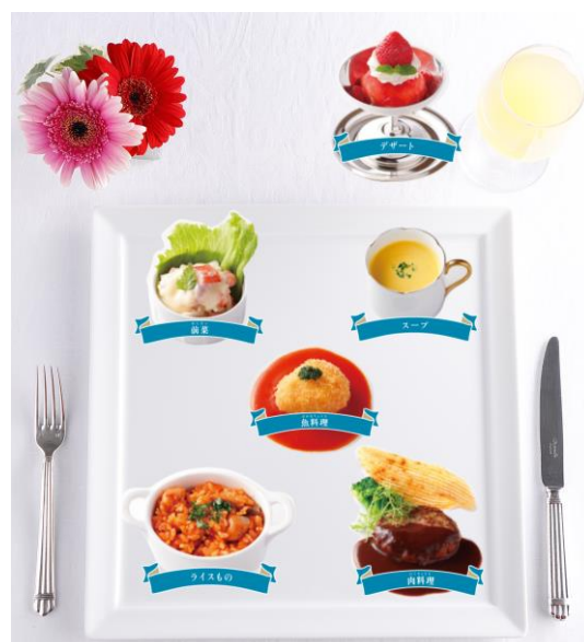
※写真はプレートのアレンジイメージです。