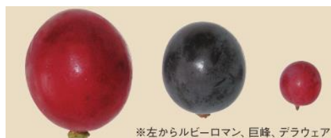
※左からルビーロマン、巨峰、デラウェア

1995年に石川県の農業試験場で生産の取り組みを開始。そこで誕生したのが「ルビーロマン」です。国内でも赤色の大粒品種はとても少ない中、大きさと色鮮やかな赤色をしていることが特長です。酸味が少なく、糖度の高い爽やかな甘みがあり、果汁も豊富で口いっぱい甘みが広がります。*（石川県より資料・情報提供）