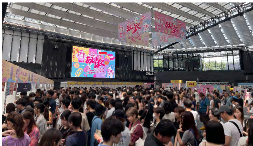
2024年に新宿住友ビル三角広場で開催された「あいぱく® Premium TOKYO 2024」の様子

具体的な販売商品や概要については、「あいぱく®」オフィシャルサイトをご確認ください。