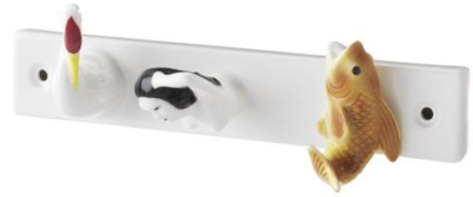
FÖREMÅL ラック フック 3 個付 ¥ 1.799