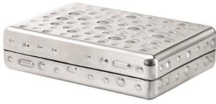
FÖREMÅL ふた付ボックス ¥ 599