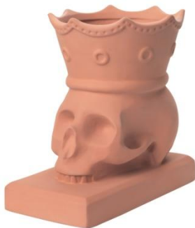
FÖREMÅL 鉢カバー ¥2,999