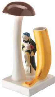
FÖREMÅL 花瓶きのこ ¥ 1.799