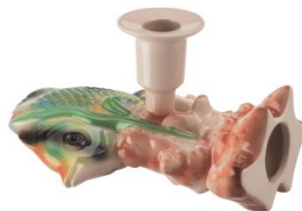
FÖREMÅL キャンドルホルダー フィッシュ ¥2,999