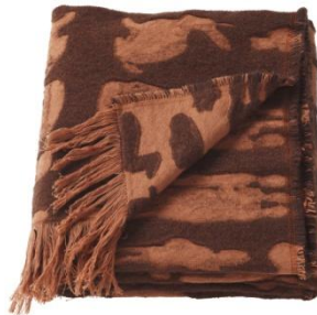
FÖREMÅL ひざ掛け ¥ 3.999