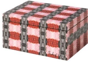
FÖREMÅL ふた付ボックス ¥ 1,299