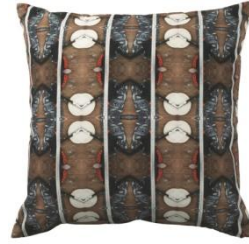
FÖREMÅL クッションカバー 各 ¥ 3,499