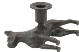
FÖREMÅL キャンドルホルダー イヌ ¥2,999