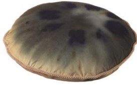
FÖREMÅL クッション ¥ 2,999