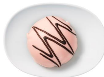
・プリンセスタルト ¥249 通常のピンク色のプリンセスタルト