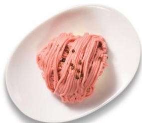
・モンブラン ¥299 あまおう苺使用のモンブラン