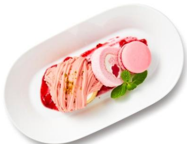
・ピンクデザートプレート ¥499 あまおう苺使用のモンブラン、桜ゼリー入り ピンクロールケーキとラズベリーマカロン