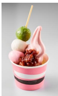
・桜サンデー ¥250 桜風味のソフトクリーム、三色団子、ゆで小豆