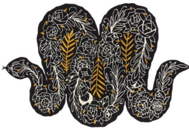
・IKEA ART EVENT 2019 ラグ パイル短 W170×L256cm デザイナー：SUPAKITCH 通常価格 69,990 円 IKEA FAMILY メンバー価格 59,990 円