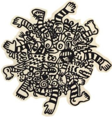
・IKEA ART EVENT 2019 ラグ パイル短 Ø200cm デザイナー：NOAH LYON 通常価格 59,990 円 IKEA FAMILY メンバー価格 49,990 円