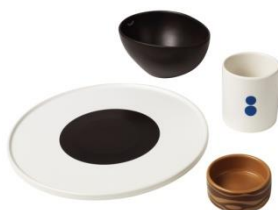
・ FÖRNYAD 食器4点セット ¥ 1,499