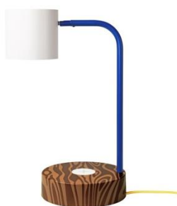
・ FÖRNYAD ワークランプ ¥ 8,999