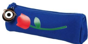
・ FÖRNYAD ペンケース ¥ 999