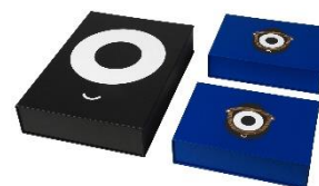
・ FÖRNYAD ボックスファイル ¥ 1,299