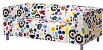
・ KLIPPAN 2人掛けソファカバー ¥ 9,990