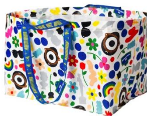
・ FÖRNYAD キャリーバッグ ¥ 299