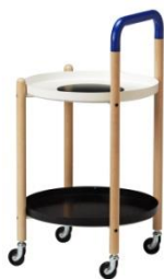
・ FÖRNYAD サイドテーブル ¥ 12,990