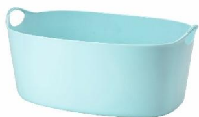
TORKIS フレキシブルランドリーバスケット、 室内/屋外用 ¥ 799 (旧価格 : ¥ 999)