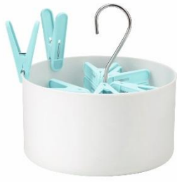
TORKIS 洗濯バサミ用バスケット 洗濯バサミ 30 個付き, 室内/屋外用 ¥ 299 (旧価格 : ¥ 349)