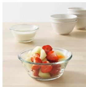
VARDAGEN ボウル ¥ 99 (旧価格 : ¥ 149)