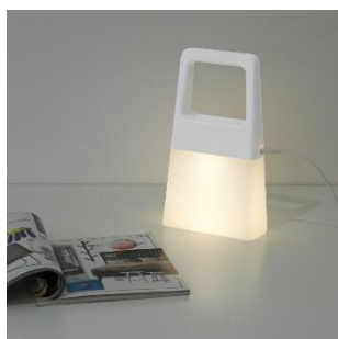
PRINSBO LED ナイトライト ¥ 2,999 (旧価格 : ¥ 3,499)