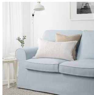
EKTORP 2 人掛けソファ ¥ 34,990 (旧価格 : ¥ 39,990)