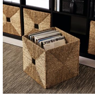
KNIPSA バスケット ¥ 1,999 (旧価格 : ¥ 2,499)