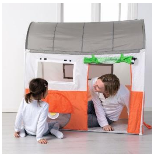
HEMMAHOS 子供用テント ¥ 2,999 (旧価格 : ¥ 3,999)