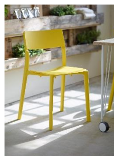
JANINGE チェア ¥ 5,990 (旧価格 : ¥ 6,990)