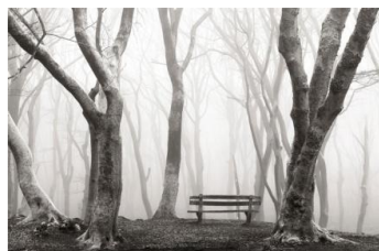
フォレストライフ