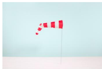
吹きながしの靴下