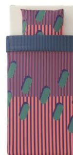
SJÄLVSTÄNDIG 掛け布団カバー & 枕カバー ¥3,499