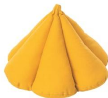
SJÄLVSTÄNDIG クッション ¥2,999