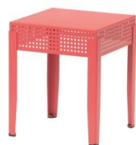
SJÄLVSTÄNDIG スツール ¥4,000