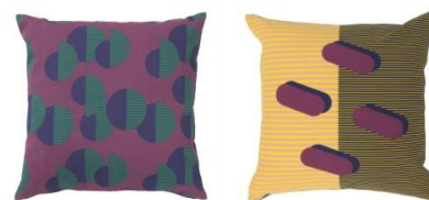
SJÄLVSTÄNDIG クッションカバー 各 ¥999