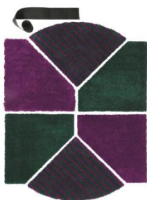
SJÄLVSTÄNDIG ラグ パイル短 ¥12,990