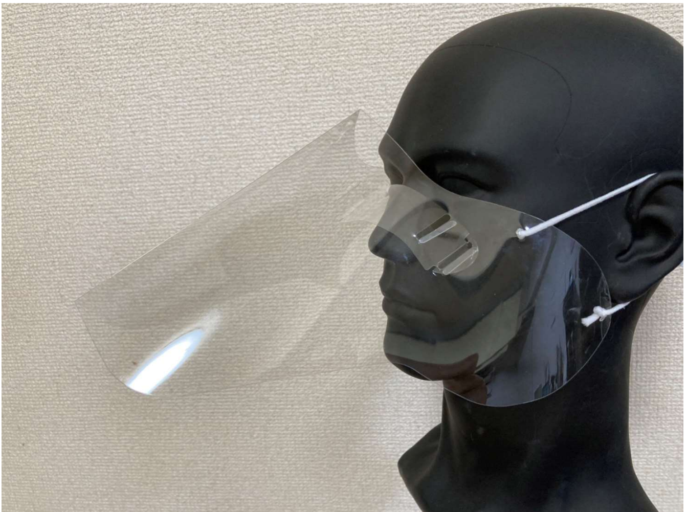
③ 口元全体を前方・サイドともにシールドでしっかりカバー。