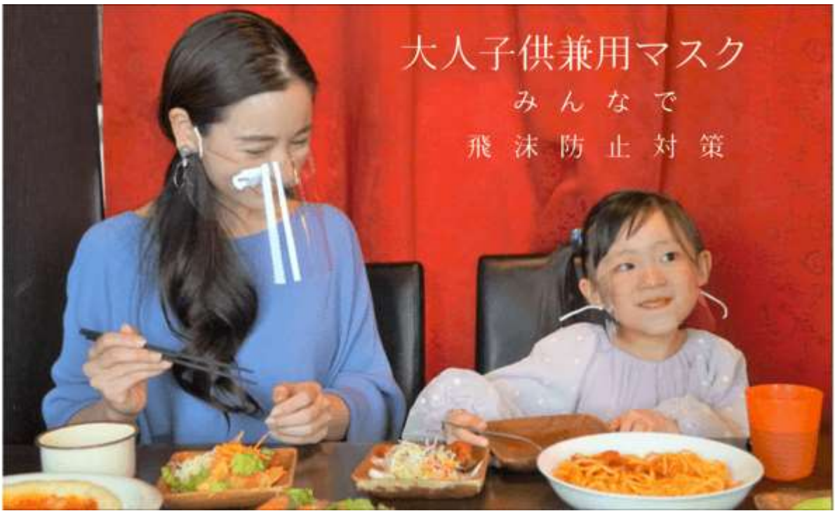
② 食事中の会話などによる飛沫の散布を軽減。