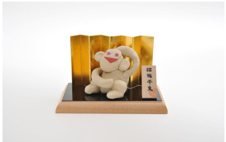
【うろ覚え干支人形】