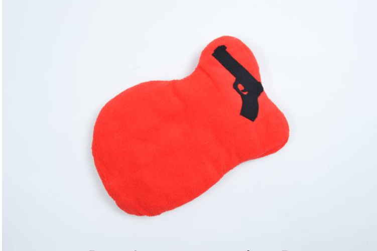
【お昼寝枕 ミステリーピロー】

※以下に関しては、メディア掲載が可能な写真素材です。ご希望の場合には、下記担当までご連絡下さい。 ※ご紹介の際は次のクレジットを明記して下さい 超玩具発想法 ザリガニワークスのスーパートイ工房(東京ニュース通信社刊)