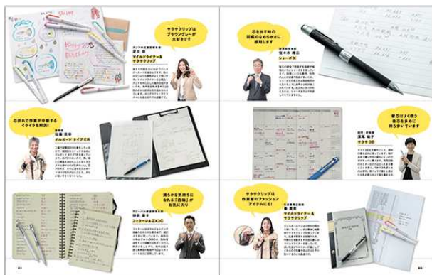
手書きの良さを知り尽くした社員が使い方を伝授