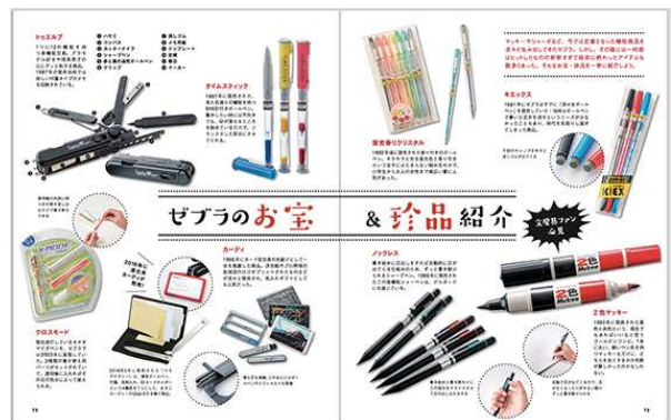
あの頃を思い出す懐かしい商品を多数紹介