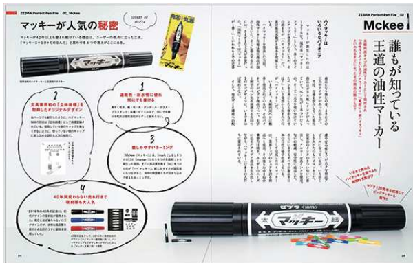
ロングセラー商品の開発秘話