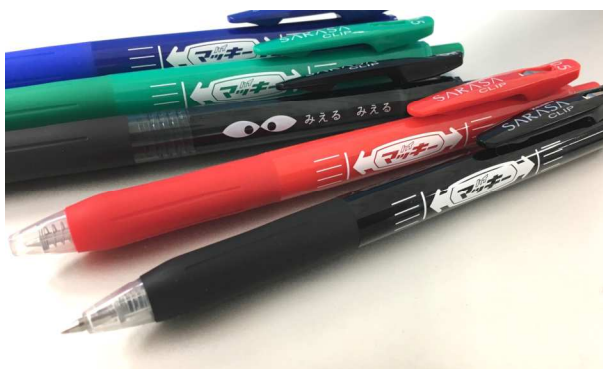
ゼブラの看板商品同士がコラボした書籍限定付録