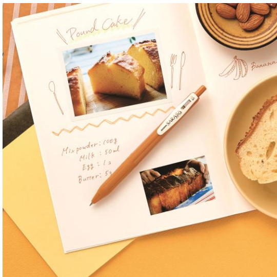
△キャメルイエロー