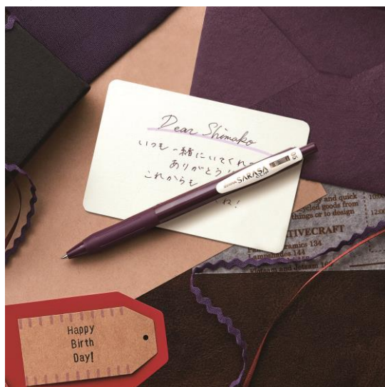
△ボルドーパープル