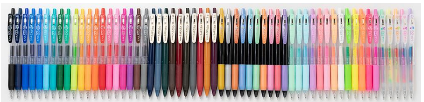
△「サラサクリップ」全57色

※2 Instagram 23.5万件(2020年2月)、58.7万件(2022年6月)