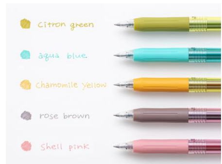
△文字を書いても読みやすいインク色

2. 本体は、インク色に合わせたカラークリア軸に同色系のクリップとグリップを採用し、シンプルながらスタイリッシュなデザインです。1色で自分の持ち物とのコーディネートを楽しんだり、複数の色を組み合わせるとオトナカラフルな世界観を楽しめます。