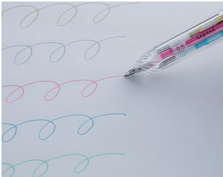
△好きな色をセットできるカスタマイズボールペンは日記と相性バツグン

マンスリー絵日記は、1枠も小さいので1色だけだとのっぺりした印象になりがち。そこで、カラフルに色分けすると、1日1日が際立ち、気持ちもグッと上がります。でも、たくさん色がそろそろ鉛筆を持ち歩くのは大変。そこで、最近は1本のボールペンに好きな色のリフィルを選んで入れられるカスタマイズボールペンというものがあるんです。よく使う色やお気に入りのカラーをチョイスできるし、マンスリー日記帳と一緒にしておけば、思い立ったときに好きな色でサッと描いたり、色ぬりもできるので便利です。カスタマイズボールペンは、1本のホルダー(軸)に4色セットすることが可能なので、1本のボールペンに