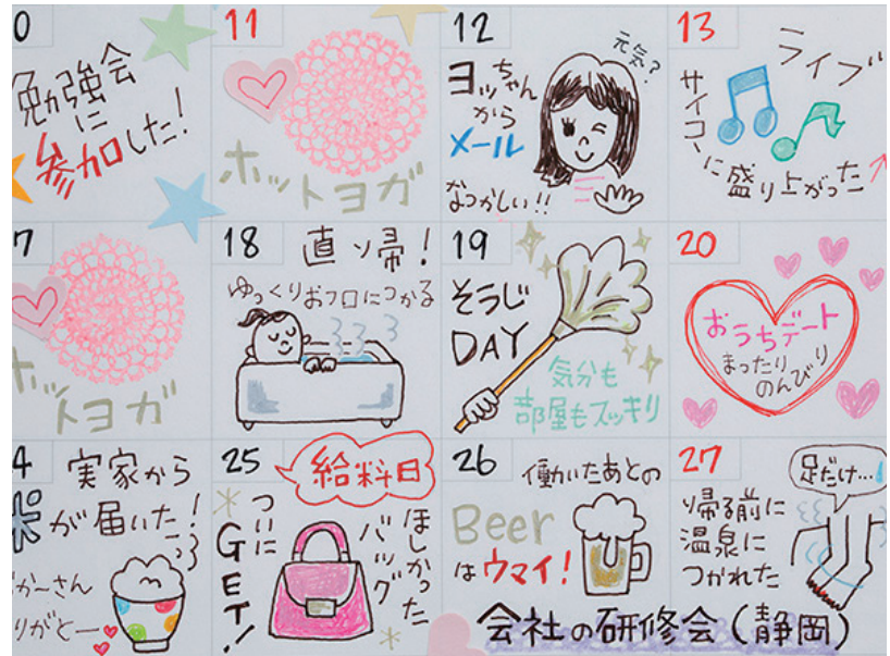
△本来なら予定を書くマンスリーページを日記に！

そうはいうものの、毎日そんなにたくさん描けないし、日記帳を使い切る自信もない。そういうときに、気軽に始められるのが「マンスリー絵日記」です。手帳やカレンダーのマンスリーページを使って、1日1枠ずつ、記録します。例えば、その日あったちょっと良いことや、頑張ったこと、またはファッションコーディネートなど。テーマを設けて1日1枠ずつ埋めていくと、1カ月後見たときに1日1日の記録と全体が一目瞭然。絵を書く代わりに図形やスタンプ、シールなどを使って手軽に楽しむのもおすすめです。