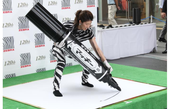
【「ビッグマッキー」で一字を披露するゲストの吉田沙保里さん】