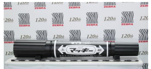
【通常の『ハイマッキー』12本との比較写真】

*認定された「最も大きなマーカーペン」は、通常の『ハイマッキー』の 12 倍の大きさになります。