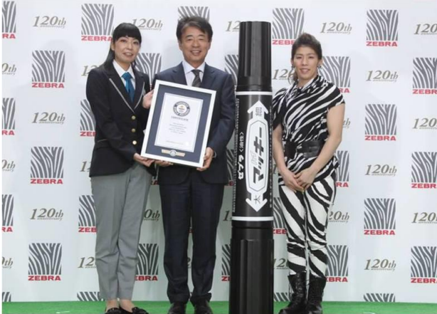
【「ビッグマッキー」で見事ギネス世界記録を達成】