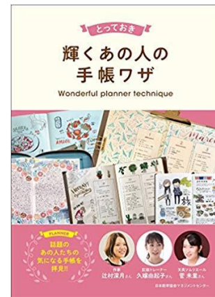
△「とっておきあの人の手帳ワザ」2018年11月 (日本能率協会マネジメントセンター 編)

株式会社日本能率協会マネジメントセンターが調査したところ、全国20~60代の男女のうち46.4%が手帳などのアナログツールを使用していると回答しました。デジタルツールでもスケジュール管理ができる一方、紙に書く安心感などの理由で手帳を活用する人は依然として多く、根強い人気があります。手帳の活用方法は、SNSを始め、関連書籍などで積極的にシェアされる傾向にあり、文字やイラストの書き方を工夫して個性を出すことが重視されています。手書きで人と違う個性を出せることも手帳の魅力の1つであり、その際に、表現しやすいペンやシールは人気が高く、注目が集まっています。