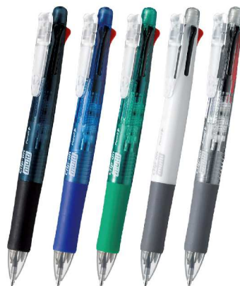
「クリップ-オン マルチ」 ボール径は0.7 mm シャープ 0.5mm インク色は黒・青・赤・緑 価格: 500円(+税)

2004年発売の、1本で黒・青・赤・緑の4色油性インクにシャープがついた、国内初の5機能ペンです。打合せや外出時の便利性と、可動式バインダークリップの採用により、厚みのあるボードなどにはさめる機能性で、多くのお客様にご愛用いただいています。