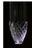
光の屈折効果を生み出す溝形状

押しやすい後端式シャープロック機構 しっかり消せる消しゴム付 インク色は黒・青・赤・緑 シャープペンは0.5mm エコマーク認定商品