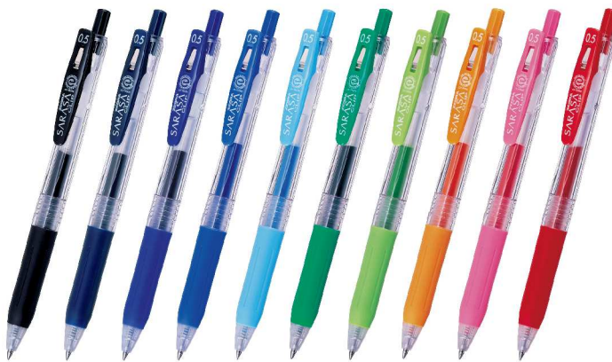
「サラサクリップ」(単色タイプ) 価格: 100円(+税)

2003年発売の、「サラサクリップ」は、濃くてにじまず、鮮やかな発色とさらさらしたなめらかな書き心地のジェルボールペンです。定番品はお求めやすい価格ながら、0.3~1.0mmまでのボール径と、全29色という色数を揃え、手帳やノート、メモ書き、宛名書きなどさまざまな用途に対応可能になっています。