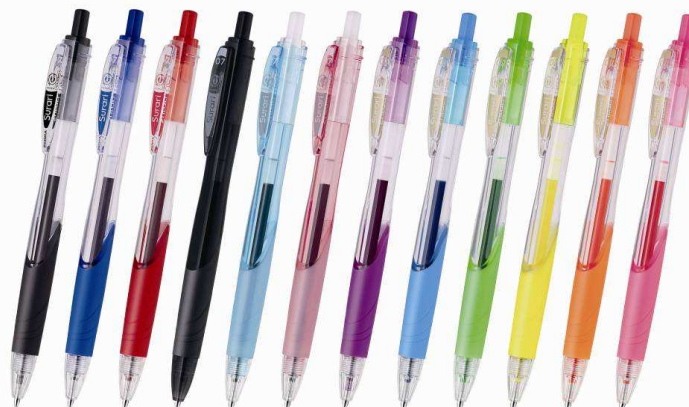
「スラリ」(単色タイプ) 価格: 100円(+税)

2010年発売の、油性の「しっかり書ける」良さと、水性の「書き味が軽い」という特長を併せ持った「エマルジョンインク」を搭載したボールペンです。書き出しが驚くほどスムーズで、いつまでも書いていたくなるスラスラの書き心地であり、速記をしてもかすれることはありません。また、一般ユーザーによる筆圧測定では、最もなめらかな指数となりました。