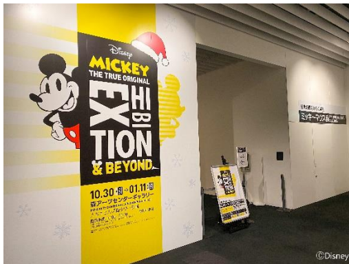
クリスマスデコレーション_エントランス

※VRでは通常の会場内を公開しています。クリスマスデコレーション ver.の会場内は公開いたしません。