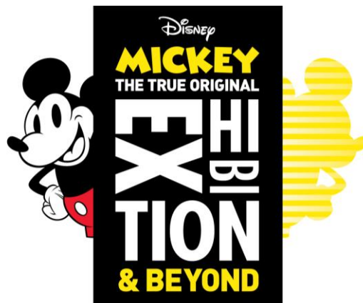
「ミッキーマウス展 THE TRUE ORIGINAL & BEYOND」キービジュアル

朝日新聞社・日本テレビ放送網は、2020年10月30日（金）～2021年1月11日（月・祝）までの期間、ミッキーマウスのスクリーンデビュー90周年を記念して2018年～2019年にニューヨークで開催された「MICKEY: THE TRUE ORIGINAL」の作品を中心とした「ミッキーマウス展 THE TRUE ORIGINAL & BEYOND」を森アートセンターギャラリー（六本木ヒルズ森タワー52階）にて開催しています。本日12月3日（木）より本展覧会の新たなコンテンツとしてミッキーマウス展の一部を無料で観覧できるVRコンテンツを公開。また同日からミッキーマウス展のクリスマスデコレーションや、17時以降に屋上スカイデッキに無料入場ができる、ホリデーシーズン限定のクリスマス特別企画も開催いたします。