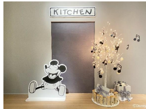
クリスマスデコレーション_原点=THE ORIGINゾーン