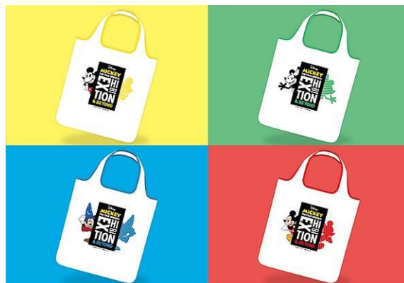
来場者特典(エコバッグ)

来場者特典として、「ミッキーマウス展 THE TRUE ORIGINAL & BEYOND」オリジナルエコバッグ(全4種)のうち、いずれか1つプレゼントいたします。※未就学児は対象外です。※十分な数量をご用意しておりますが、なくなる場合がございます。※非売品です。※画像はイメージです。※ランダム配布のため絵柄はお選び頂けません。