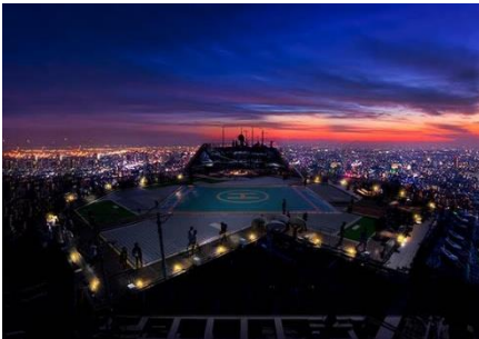
スカイデッキイルミネーション イメージ

また、本展の会場となっている六本木ヒルズにある展望台、東京シティビュー 屋上スカイデッキでは、12月25日(金)まで夜景、音楽、揺らぎの灯りが共鳴したイルミネーションを楽しめる“Heartwarming Symphony (ハートウォーミングシンフォニー)”を開催中。