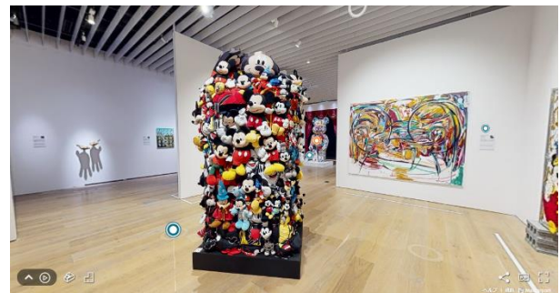
VR イメージ_現代=THE TRUE ORIGINAL ゾーン

東京・六本木で開催中の「ミッキーマウス展 THE TRUE ORIGINAL & BEYOND」。SNSでは、「ディズニー好きにはたまらない」「ファンタジア作品に感動した」など来館者からの感想が多数投稿され、盛り上がりを見せています。また東京以外の都道府県への巡回を希望する声も多くいただいていることから、本日12月3日（木）より会場内の一部展示をVRで無料公開いたします。来場前の予習用として、また会場でリアルに鑑賞していただいた感動をもう一度味わいたい方はもちろん、遠方にお住まいの方や来場が難しい方々にも、ご自宅でお手軽にミッキーマウス展の一部をお楽しみいただけます。また、VR上のミュージアムショップでは、ミッキーマウス展のオリジナル商品の購入も可能です。