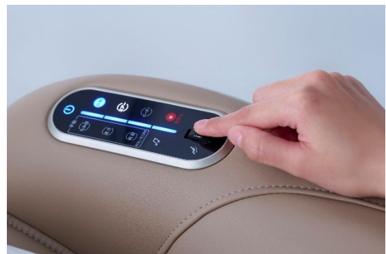
ユーザーインターフェース向上にこだわった操作部

左右に配置した Bluetooth®スピーカーはスマートフォンなどを接続し、お好きな音楽や内蔵の 5 つのヒーリングミュージックを流すことで、贅沢な音響空間を楽しめます。