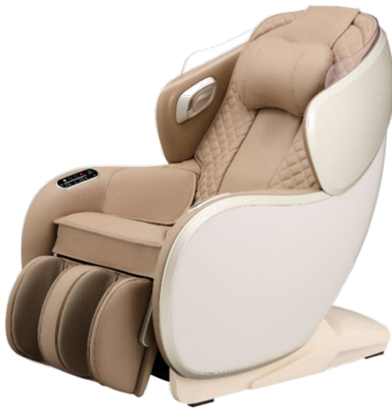
ベージュ×ベージュ(CC)

「SYNCA」は、高い機能性と洗練されたデザインで、上質で健康なライフスタイルを提案する美容健康ブランドです。2023年9月に当社と会社統合を行ったジョンソンヘルスケア株式会社で展開していたブランドを引き継ぎました。