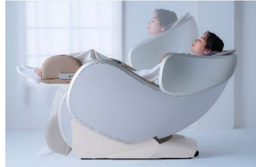
ゼロフロートリクライニング