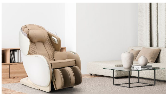
ベージュ×ベージュ(CC)

マッサージ機能としては、体にフィットしやすい弾力のある素材の独自のもみ玉で全身をしっかりと揉みほぐす「GRACE メカ」が、首からお尻まで約 95cm の幅広い施療範囲を滑らかにマッサージします。腰まわりやふくらはぎはエアーマッサージで包み込むようにほぐし、全身リラックスしてマッサージをお楽しみいただけます。