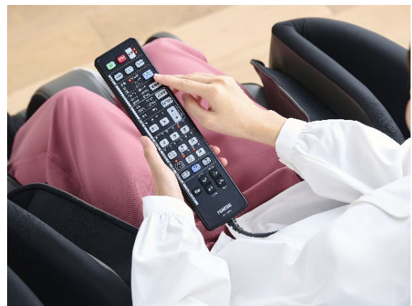
下半身コースが新登場

他にもその日の気分やお好みに合わせて選べる 6 種類のマッサージコースと、疲れやすい部位を重点的にケアする 6 種類の部位別専用技を用意しています。