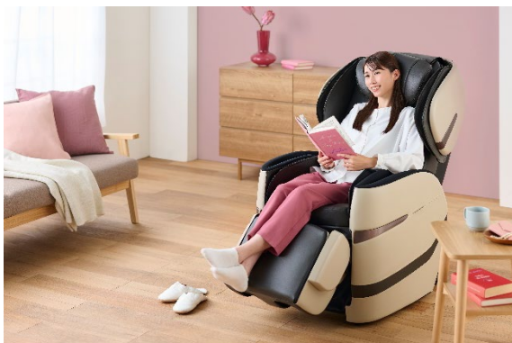
リクライニングチェアとして利用

座面が前方へスライドする構造のため、後方約 15cm のスペースでフルリクライニングが可能です。マッサージ機能を使用しない時は脚部を反転してフットレストに、さらに本体内部へ収納することもできますので、見た目もコンパクトに、リクライニングチェアとしても快適にお使いいただけます。