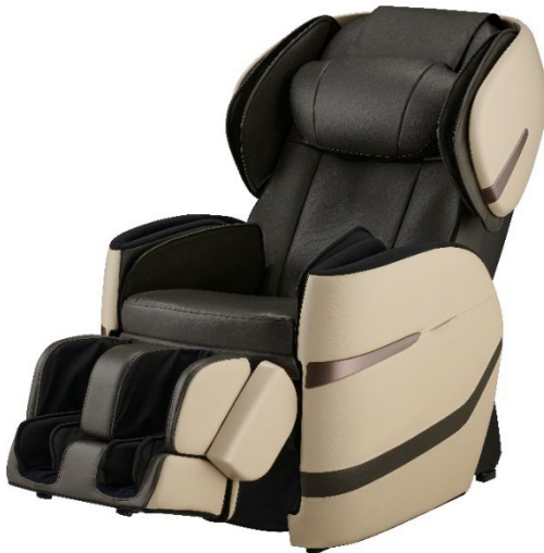
ベージュ×ブラウン(CB)

美と健康の総合メーカー、株式会社フジ医療器(本社:大阪府中央区)は、リニューアルしたエアータグで骨盤まわりの疲れを包み込むようにほぐす「骨盤ほぐし座エア」を新搭載した「リラックスマスター マッサージチェア E25 AS-R640」(以下、AS-R640)を2026年6月30日に発売しました。