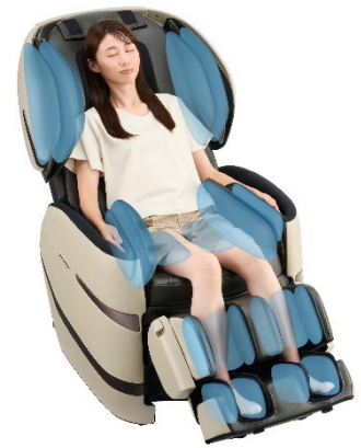
全身に 22 個のエアバッグ

また、一気にエアを送り込み通常のエアーマッサージよりも長い時間で部位をじっくり圧迫する「エアじっくりモード」を新搭載しています。エアバッグの開放とともにスッキリと力が抜けるような深い心地よさをお楽しみいただけます。この「エアじっくりモード」はエア動作が含まれるマッサージ全てに適用することができます。