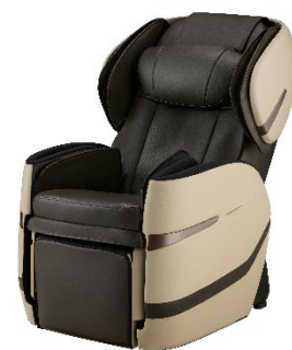
脚部は本体内部に収納可能