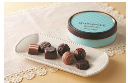
【グラティテュード】