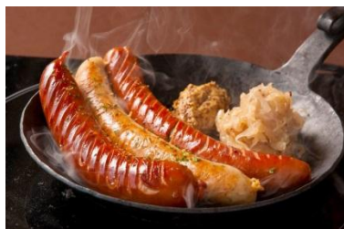
ドイツ直輸入ソーセージ