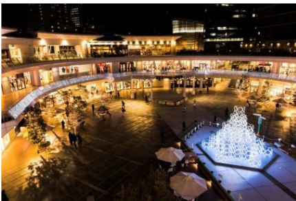
SUPPOSE DESIGN OFFICE Co., Ltd.