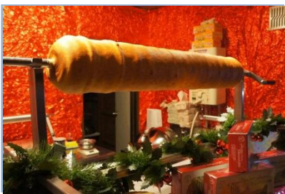
焼き立てバウムクーヘン