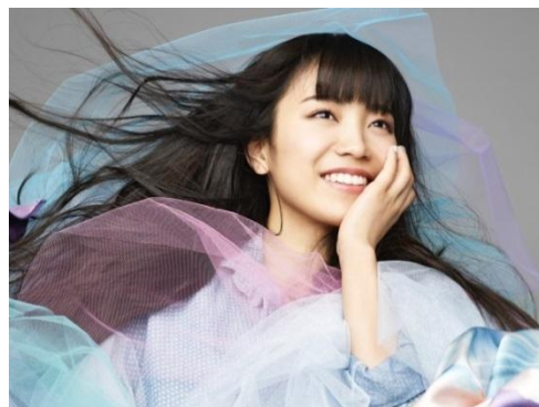
“LAZONA LOVES MUSIC supported by SPACE SHOWER TV” 第5弾アーティスト “miwa”