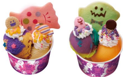
「サーティワンアイスクリーム」 ハロウィンサンデー シングル500円(税込) ダブル670円(税込)