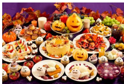
「ビタースイーツ・ビュッフェ」 ビタースイーツハーベスト 【ハロウィンプレミアム】 2,380円(税込)～(ビュッフェ料金)