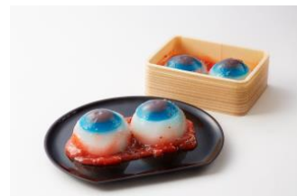
「菓子匠 末広庵」 目玉の水まんじゅう(2個入) 540円(税込) ※数量限定