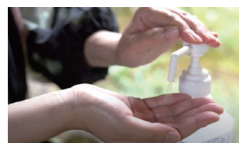
入念な手指の消毒