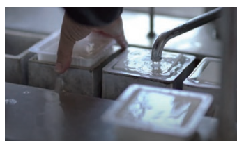
昔ながらの製法を守る豆腐店