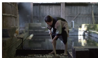
美肌の湯の浴場も清潔に