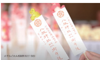
犬子ひょうたん祇園祭

旅館に戻った彼女は、お客さまが快適に過ごせるよう客室の清掃を念入りに始めます。疫病退散を祈って、朝授与された御守や季節の花々を床の間に飾ったり。心を込めた手仕事で温泉を清め、湯揉みのように湯加減を整えていくのです。最後はお客さまを笑顔でお迎えし、「今日も、ていねいに、ひたむきに。」というメッセージとともに締め括ります。