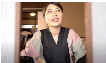
客室の換気も徹底