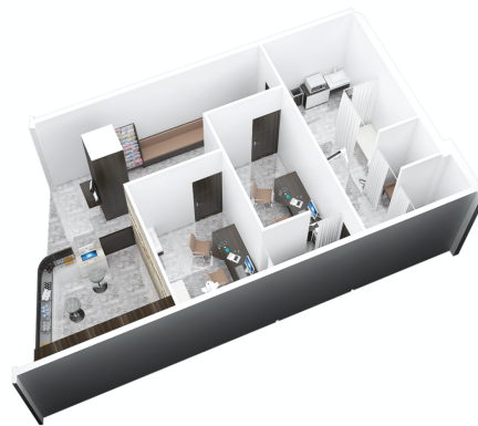
▲ベトナムにおけるスマートクリニック1号店「METiC」イオンモール ハドン店

ベトナムは人口が増加（2020年に9,836万人、2030年に1億628万人）し、コロナ禍の本年もプラス成長（+2,8%）を維持、経済成長率世界5位と社会経済が急成長しています。