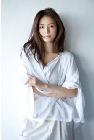
■ 撮影：北田 理純