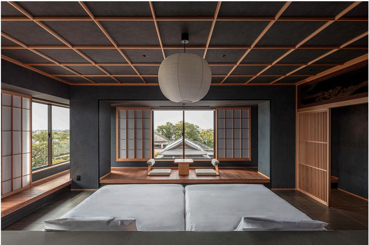
国指定文化財の庭園と建物が眼前に広がる日本庭園「松濤園」側の客室は、景色の視認性を上げ、文化財に泊まる魅力をより堪能いただける空間に。

御花は「芸術上又は観賞上価値の高いもの」として国から指定を受けている文化財に宿泊できる、という稀有な機会を提供する場です。滞在を通して歴史と文化が創り上げてきた「本物」をこれまで以上に感じ体験していただける場を目指して、装飾的な部分は極力削ぎ落としながら「本物」がより引き立つ空間として改修設計を行いました。