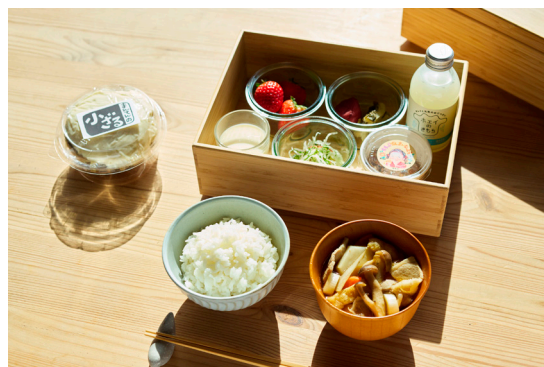
朝食：味噌や納豆など秩父の発酵食を味わえる和朝食