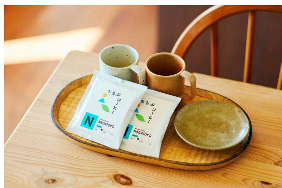
客室の器の一部やトレーには地元づくり手によるものを。地域の素材を使ったクラフトドリンクやスナックもお楽しみいただけます。