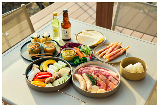
夕食：ウッドデッキで楽しむBBQまたは鍋

山々に囲まれている秩父地方は古くから保存食の文化が発達し、盆地の気候風土と山々からの良質な水により、銘酒や味噌、漬物など地域特有の発酵文化が育まれてきました。客室で楽しめる食事でもその食文化に触れていただけるよう発酵研究・料理家の真藤舞衣子氏監修によるメニューをご用意します。