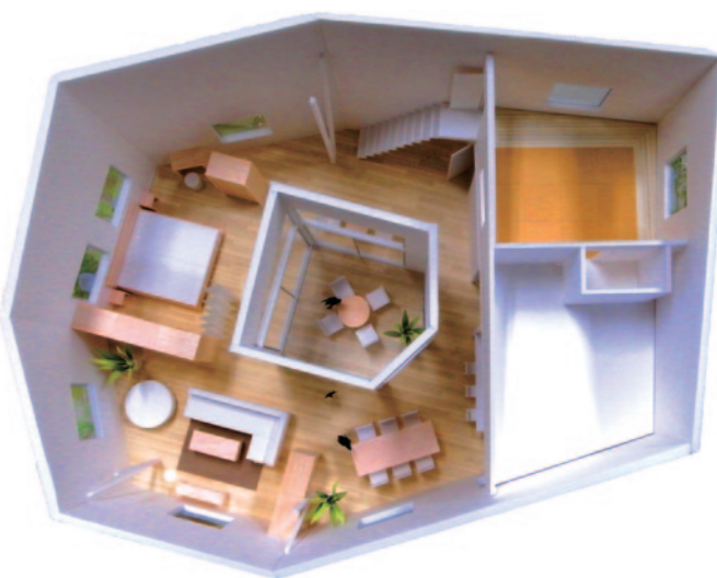
ライフステージに合わせて可変性の高いデザインを採用

フューチャーセンターとは、企業・政府・自治体などの組織が中長期的な課題の解決を目指し、様々な関係者を幅広く集め、対話を通じて、新たなアイデアや問題の解決手段を見つけ出し、相互協力の下で実践するために設けられる施設のことです。