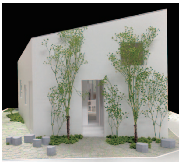
薩摩川内市スマートハウス模型の外観

現在、全国の各地方自治体で、「市民との対話」の重要性が益々高まり、フューチャーセンターに注目が集まっています。鹿児島県薩摩川内市は、次世代エネルギービジョンを2013年3月に策定、「次世代エネルギー」に関して、市民意識の向上と対話を目指すまちづくりを進めています。UDSでは、その施策を推進する上で、同市が建設を予定するスマートハウスにおいて「施設一体型フューチャーセンター」としての運用を事業コーディネイターとして提案し、本年7月に完成予定です。同施設は、市民が気軽に集い、次世代エネルギーを取り入れたスマートな暮らしを身近に体感できるもので、「市民との対話」の場を自然な形で設けられる画期的な取り組みです。施設一体型のフューチャーセンターは、地方自治体運営では、日本初となります。