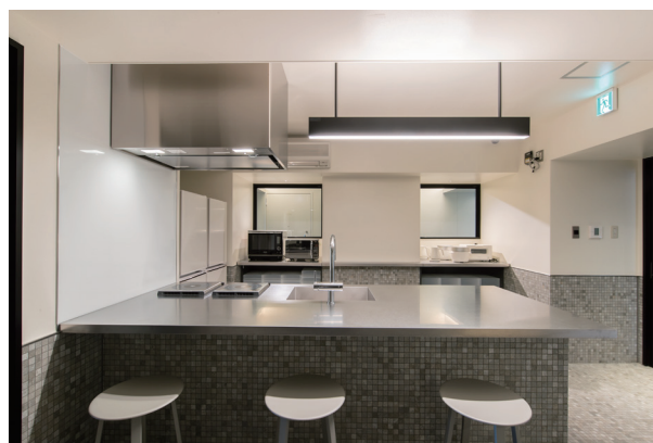
(共用部)9・10Fシェアタイプフロア。エレベーターを降りてすぐには、対面式のカウンターキッチン。

UDSでは、NODE GROWTH 湘南台を皮切りに今後さらなる学生レジデンスの展開を目指します。