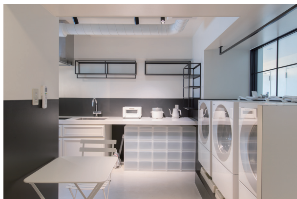
(共用部) 2～8Fエレベーターホールに設けたランドリーキッチン。洗濯機の待ち時間がコミュニケーションのきっかけになります。