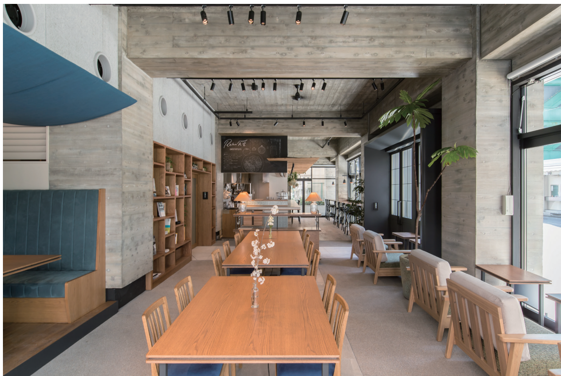
1階 リラックス食堂 湘南台内観

UDS株式会社（所在地：東京都渋谷区、代表取締役社長：中川敬文 以下UDS）が企画・設計・運営を手がける学生レジデンス「NODE GROWTH 湘南台」（ノード グロース ショウナンダイ）が2018年4月2日、神奈川県「湘南台駅」前にグランドオープンいたします。