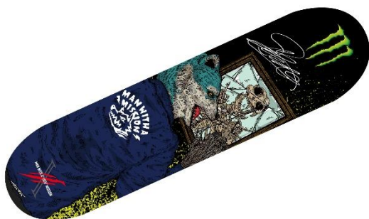
MAN WITH A MISSION × 平野歩夢 × モンスター トリプルコラボスケートボード