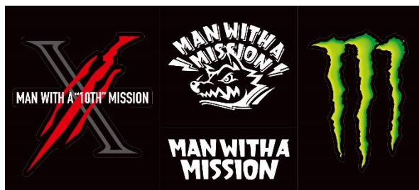
10周年限定デザイン ステッカー