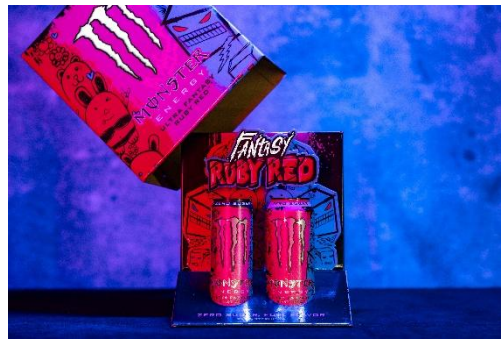
モンスター ウルトラファンタジールビーレッド スペシャルボックス