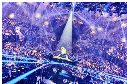
「Vaundy DOME TOUR2026」 ペアチケット