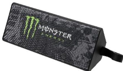
モンスター スピーカー