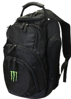
モンスター バックパック