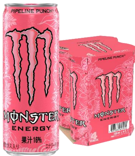
モンスター パイプラインパンチ 缶355ml×4本マルチパック