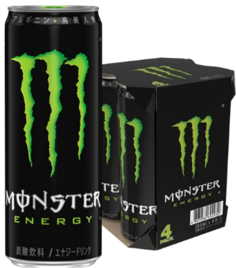
モンスターエナジー 缶355ml×4本マルチパック