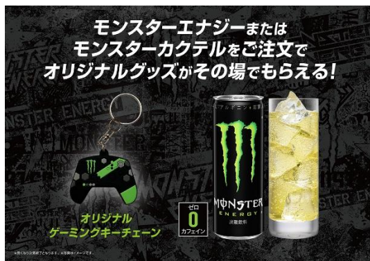
【東京・大阪】 モンスターエナジー オリジナルグッズプレゼント