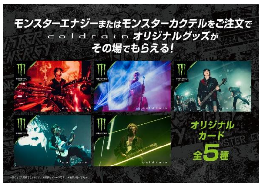
【名古屋】 coldrain オリジナルステッカープレゼント