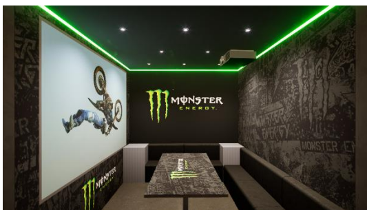
【東京・大阪】モンスターエナジー コラボルーム