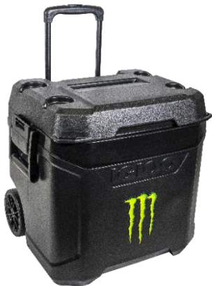
クーラーボックス