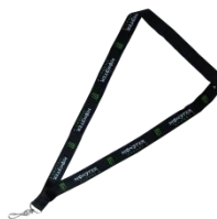
モンスターエナジー ネックストラップ