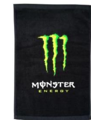
モンスターエナジー タオル