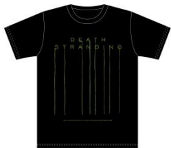
デス・ストランディング コラボTシャツ