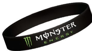
シリコンリストバンド