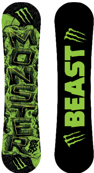
表 裏 スノーボード