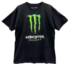
メンバー直筆サイン入り モンスター Tシャツ

オリジナルステッカー . . . 各店20枚 ※無くなり次第終了 ※各店につきcoldrain キャンペーン限定ステッカー4種×4枚と、 モンスター ロゴステッカー 1種×4枚