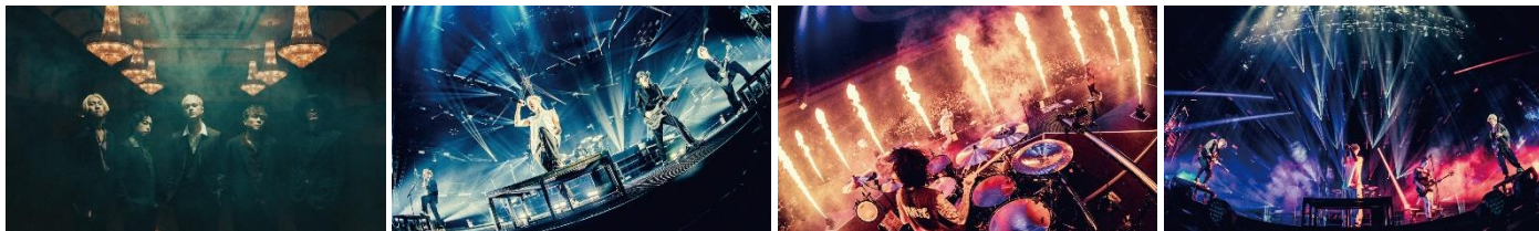
coldrain キャンペーン限定ステッカー4種