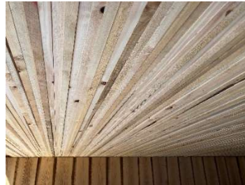
BSボード 天井側の様子