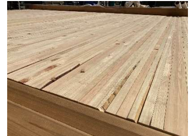
BSボード 床側の様子

株式会社長谷川萬治商店/株式会社長谷萬では、この受賞を契機に、「BSボード」の受注拡大に向けて、「BSボード」ならびにDLT(Dowel Laminated Timber)の認知拡大を進め、中小製材事業者と連携しながら、多様な木材活用に貢献してまいります。