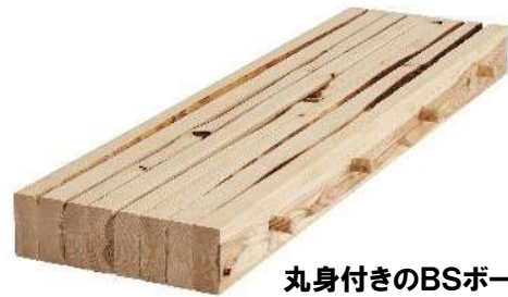
丸身付きのBSボード

製品木材の断面形状や配列によって、多彩な製品の製造が可能となります。「丸身」など、B級材もこれまでの木材製品とは逆の発想で、木材のラフ感が魅力の意匠材として活用するようにいたしました。「丸身」とは、丸太の丸い皮つき部分が一部に残る製材で、昨今、建築用材で好まれないグレードの木材です。こうした部分はバイオマス向けのチップ材などに活用することが多いですが、意匠材などより高単価の材料として利用が可能となり、製材の歩留り向上や高付加価値化につながります。また、顧客やデザイナーの要望に合わせた、あえて鋸目が残る仕上がり感や、不揃いな色あいに板材を配列するなど、構造材でありながら、デザイナーの意匠面の要望に応えやすい素材です。