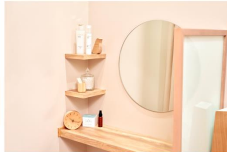
温かみのある照明と白を基調にした隠れ家的な雰囲気の店内 恵比寿駅徒歩1分、完全個室・隠れ家的なプライベートサロン