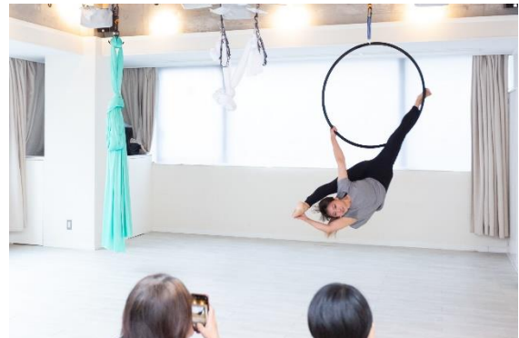
▲感動的なMai先生のデモンストレーション。音楽に載せて自在にフープを操って空中を舞う姿に一同ため息。