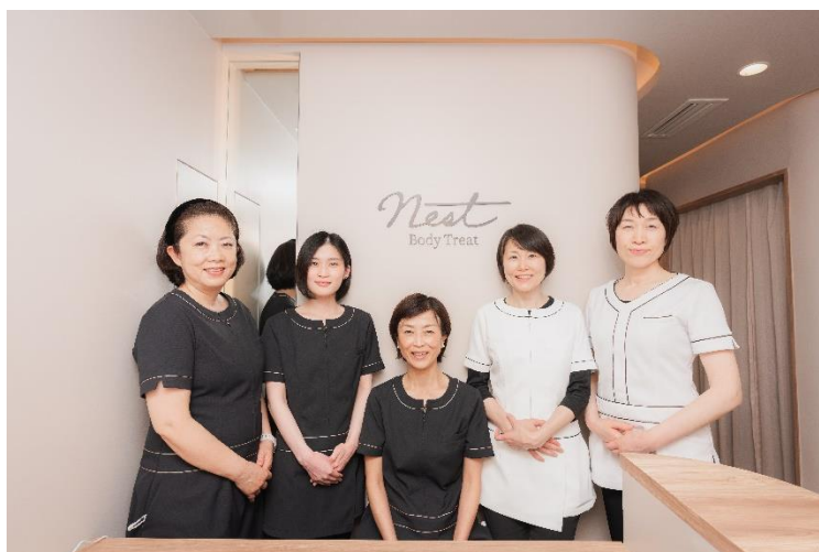
女性セラピストによる完全個室・完全予約制の女性専用美容整体サロンです。