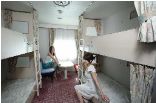
⑤おがさわら丸 1等船室 (イメージ)