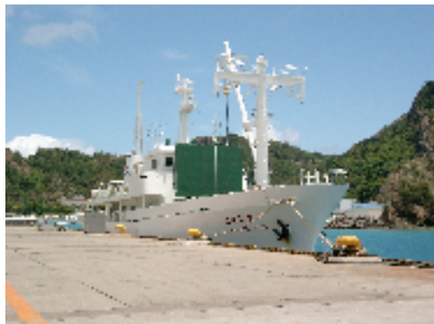
⑧ははじま丸 (イメージ)