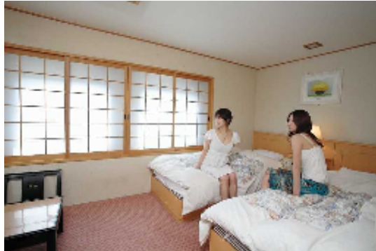
⑥おがさわら丸特1等船室 (イメージ)