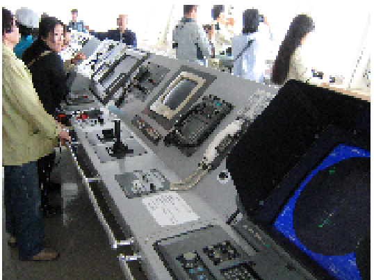
⑨おがさわら丸操舵室 (イメージ)