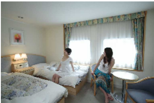
⑦おがさわら丸特等船室 (イメージ)